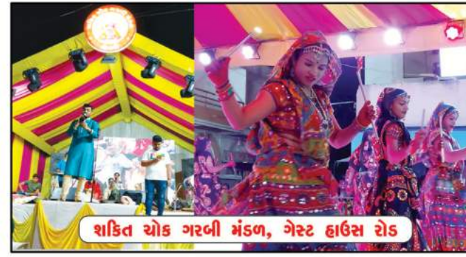
શક્તિ ચોક ગરબી મંડળ, ગેસ્ટ હાઉસ રોડ