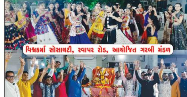
વિશ્વકર્મા સોસાયટી, રવાપર રોડ, આયોજિત ગરબી મંડળ