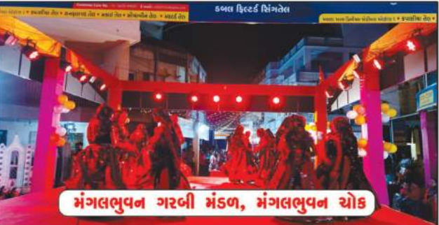
મંગલભુવન ગરબી મંડળ, મંગલભુવન ચોક