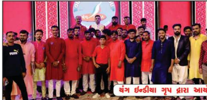
યંગ ઇન્ડીયા ગ્રુપ દ્વારા આયોજિત સંકલ્પ નવરાત્રિ મહોત્સવ