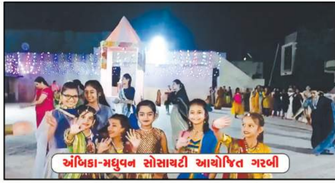
અંબિકા-મહુવન સોસાયટી આયોજિત ગરબી