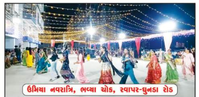
ઉમિયા નવરાત્રિ, ભવ્યા ચોક, રવાપર-ઘુનડા રોડ