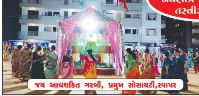
જય આશ્રમિકત ગરબી, પ્રભુજ સોસાયટી, રવાપર