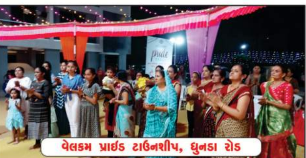
વેલકમ પ્રાર્થક ટાઉનશીપ, ઘુનડા રોડ