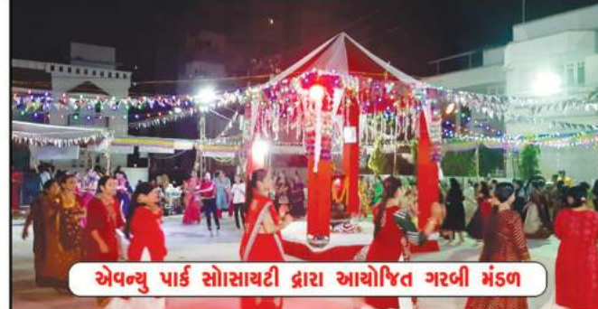
એપવુ પાર્ક સોસાયટી દ્વારા આયોજિત ગરબી મંડળ