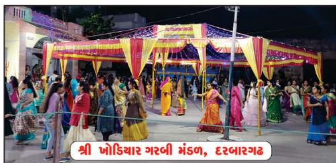
શ્રી બોકિયાર ગરબી મંડળ, દરબારગઢ