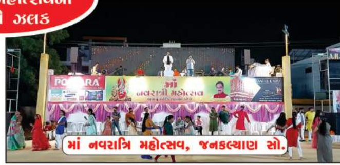
મા નવરાત્રિ મહોત્સવ, જનકલ્યાણ સો.