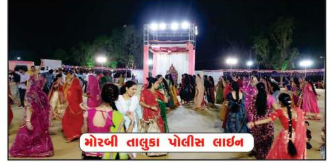
મોરબી તાલુકા પોલીસ લાઇન