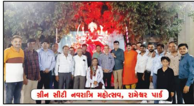
શ્રી સોટી નવરાત્રિ મહોત્સવ, રામેશ્વર પાર્ક