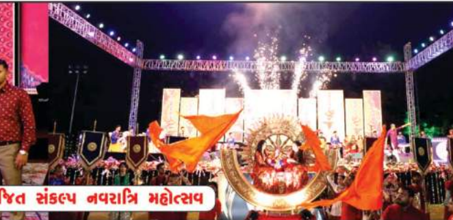
ઉમા ટાઉનશીપ, મોરબી-૨