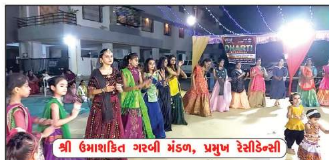
શ્રી ઉમાશક્તિ ગરબી મંડળ, પ્રભુજ રેસીડેન્સી