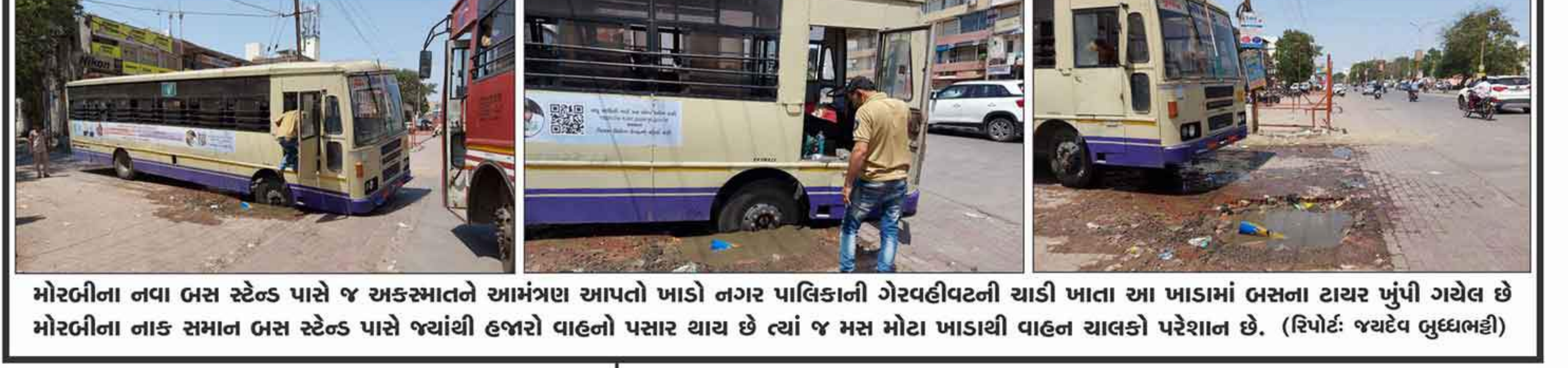
મોરબીના નવા બસ સ્ટેન્ડ પાસે જ અકસ્માતને આમંત્રણ આપતો ખાડો નગર પાલિકાની ગેરવહીવટની ચાડી ખાતા આ ખાડામાં બસના ટાયર ખુંપી ગયેલ છે મોરબીના નાક સમાન બસ સ્ટેન્ડ પાસે જ્યાંથી હજારો વાહનો પસાર થાય છે ત્યાં જ મસ મોટા ખાડાથી વાહન ચાલકો પરેશાન છે. (રિપોર્ટ: જયદેવ બુદ્ધભટ્ટી)