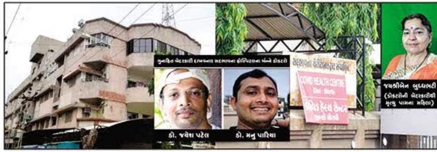
લૂંટવાની મેલી રમત ના અનેક દર્દીઓ છે, ટૂંક સમયમાં જ જે ડોક્ટરોના નામ-સરનામા સહિતની વિગતવાર બોગ બન્યા છે, તેની યાદી ઘણી લાંબી શિકાર બન્યા છે તે તમામ લોકોના યાદી બહાર પાડીશું, આ ડોક્ટરોની

ઉકરડાઓની સફાઈ કરવી જરૂરી છે, જેથી આમ જનતાના રૂપિયા અને જાન બચાવી શકાય, ઉપરોક્ત ડોક્ટરો પાસે સગભાં મહિલા નિદાન માટે જાય ત્યારે તેને તાત્કાલિક સિઝેરિયન કરાવવાનો આગ્રહ રાખે, માતા અને બાળક બંને નો જીવ જોખમમાં છે તેવું જણાવી મહિલાના સ્વજનોને ડરાવી- ગભરાવી નિર્દયતાપૂર્વક રૂપિયા પડાવવાનો ખેલ શરૂ કરે જેથી અનેક મધ્યમ વર્ગના આમ આદમી આર્થિક રીતે બરબાદ થઈ રહ્યા છે, મોરબીની સદભાવના હોસ્પિટલના ડોક્ટરોની રૂપિયા